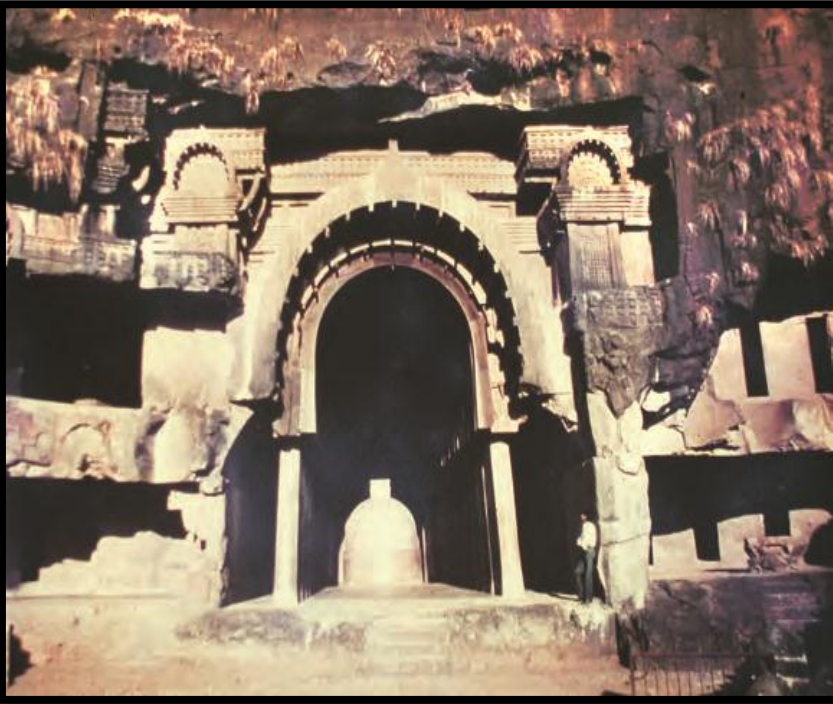
कार्ले इत्यस्य गुहा, महाराष्ट्रम्

तीर्थयात्रिणः ते स्त्रीपुरुषाः भवन्ति, ये प्रार्थनायाः कृते पवित्रस्थानानां यात्रां कुर्वन्ति ।